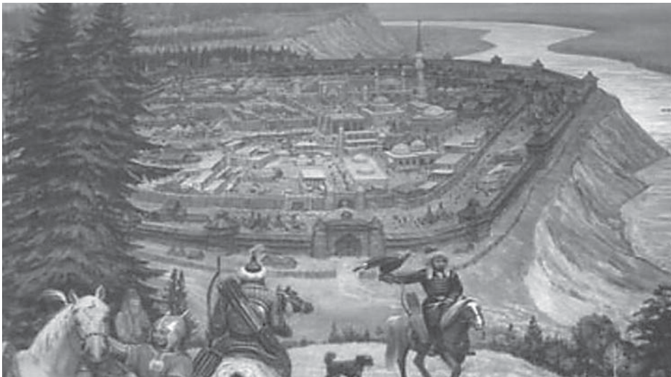
Столица сибирского ханства Искер

Миссия Лещинского была в основном направлена на крещение северных наро-